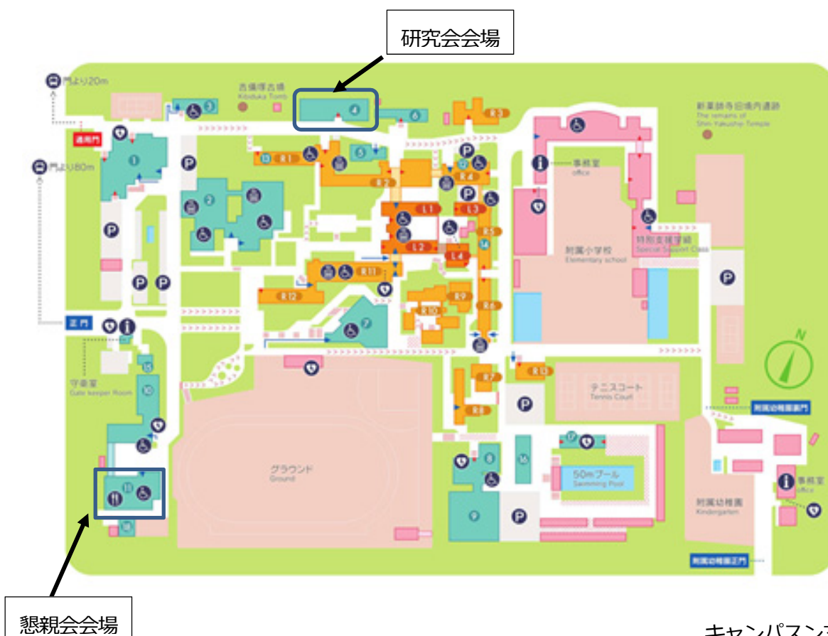
キャンパスンマップ