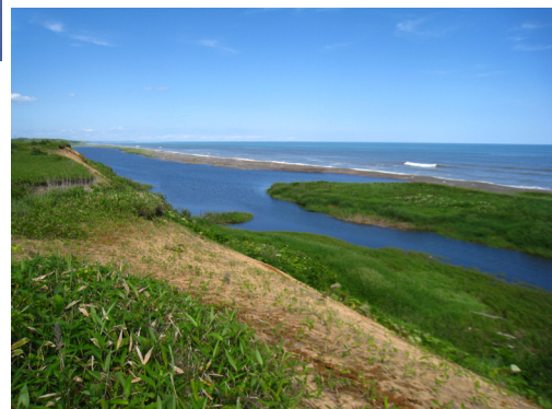
生花苗沼と太平洋