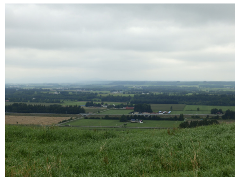
十勝平野の河岸段丘