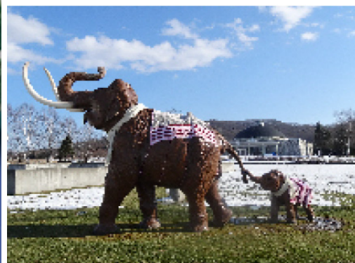
ナウマン象親子の生体復元模型