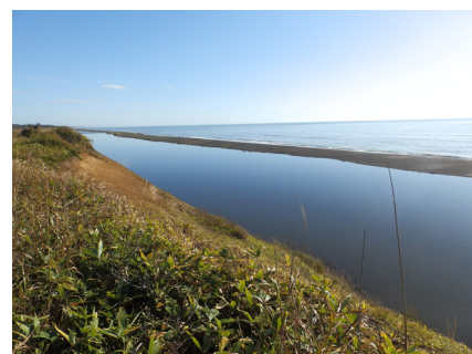
生花苗沼と太平洋